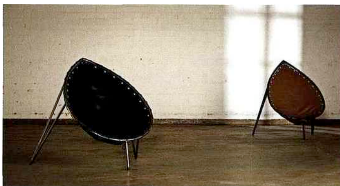
Fauteuils Bouclier de Kimmo Kaivanto (1954)